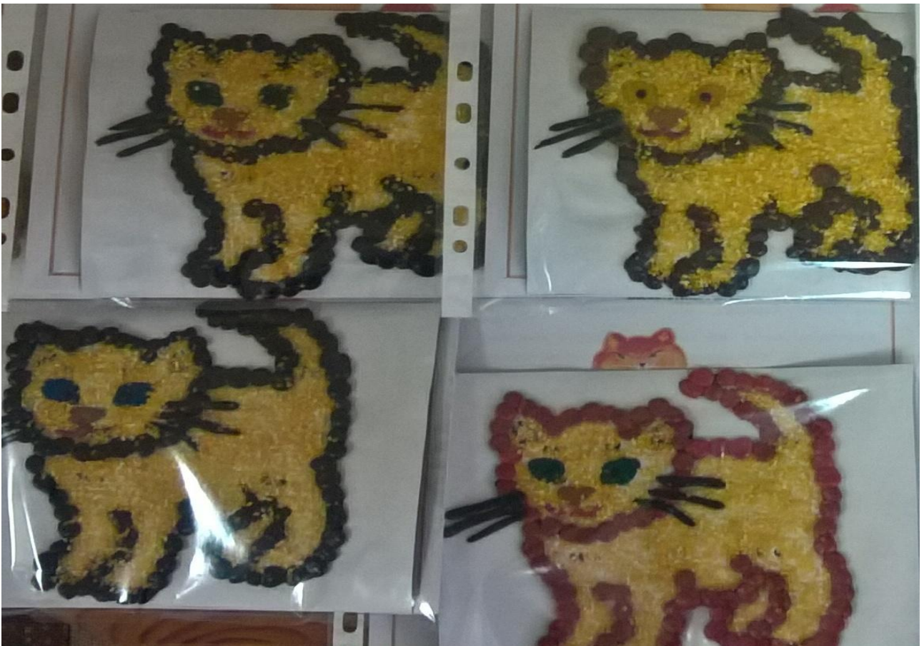
Объёмное рисование кошки пластилином и крупой