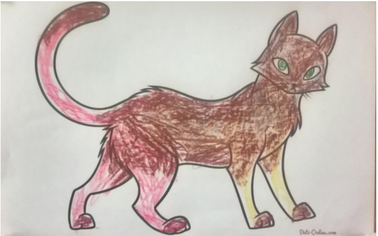
Раскрашивание контура кошки восковыми мелками, карандашами