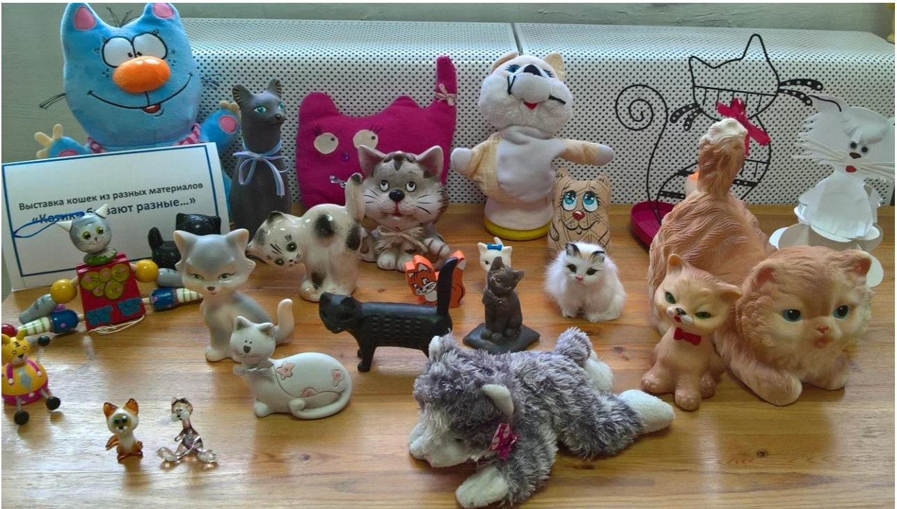
Выставка котиков из разных материалов