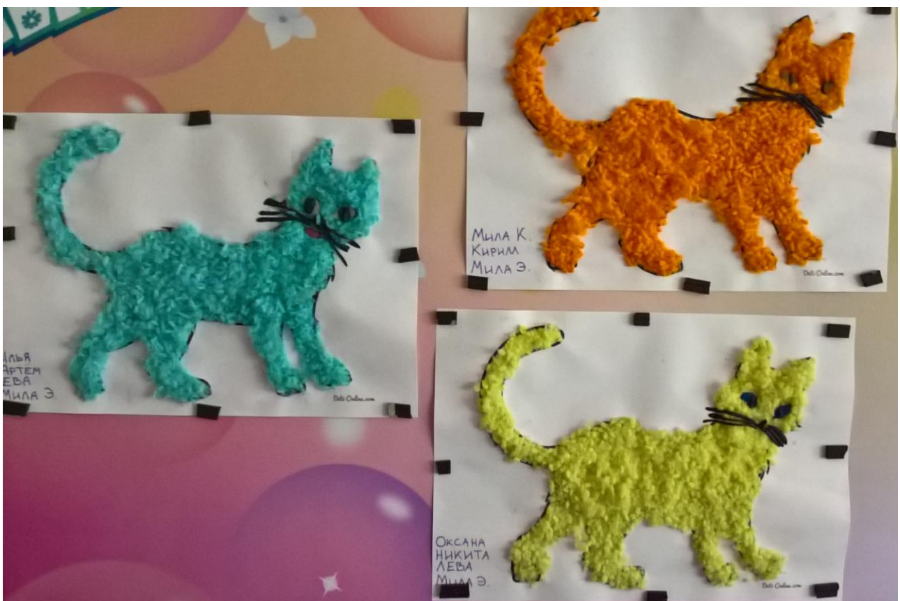
Объёмное рисование шерсти кошки нарезанными нитками