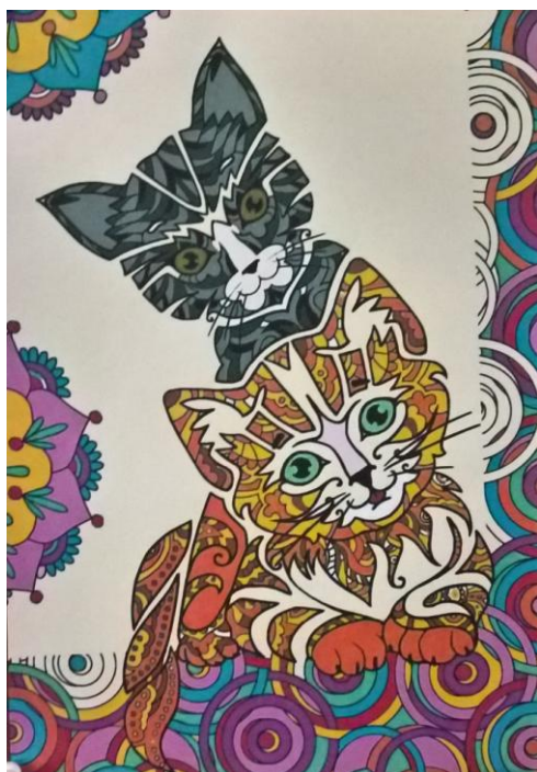
Раскраска в Paint.net