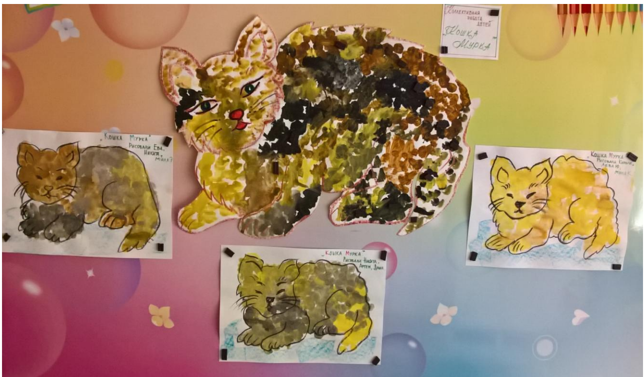
Рисование шерсти кошки приёмом примакивания